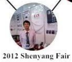
2012 Shenyang Fair