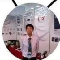
2012 shen yang Fair