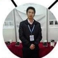
2013 shen yang Fair