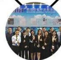
2015 Shenzhen Fair