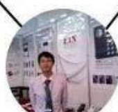
2012 Shenyang Fair