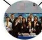
2015 Shenzhen Fair