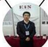
2013 Shenyang Fair