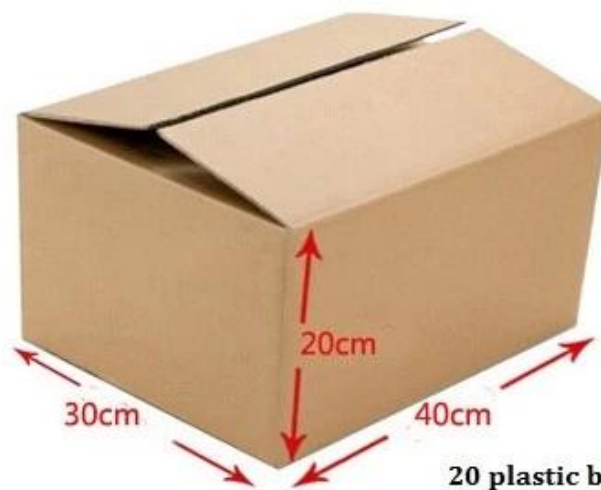
20 plastic bags/carton