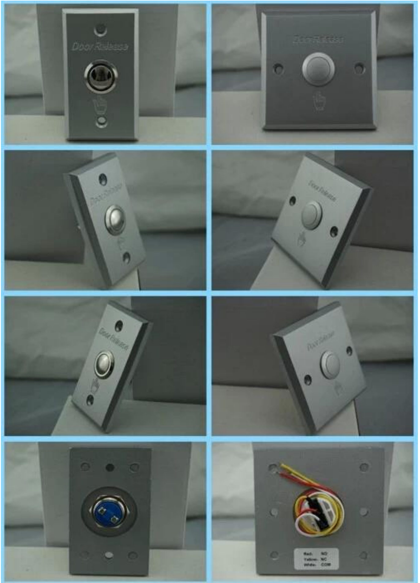
Bouton de déverrouillage de porte avec le bouton de sortie de