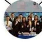
2015 Shenzhen Fair