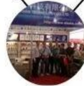
2013 Shenzhen Fair