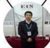
2013 Shenyang Fair