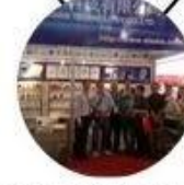
2013 Shenzhen Fair