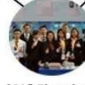
2015 Shenzhen Fair