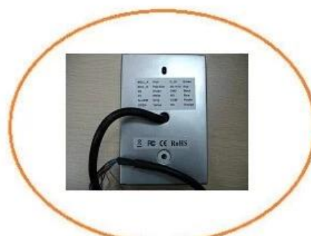
Back of the reader