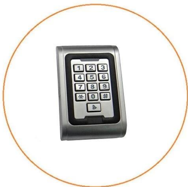
Single door access control (Waterproof ,LED light ,metal case)

Porta di controllo di accesso della tastiera del lettore è la casella di controllo per la gestione di accesso cassa del metallo per porta.