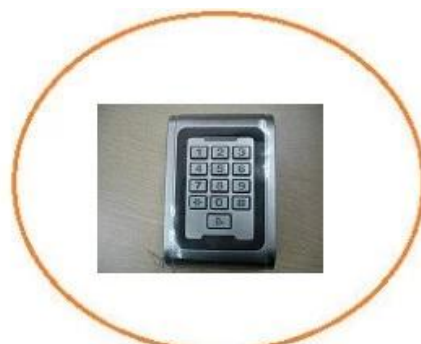
front of the reader