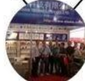
2013 Shenzhen Fair