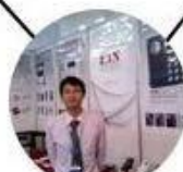
2012 Shenyang Fair