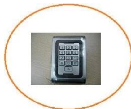
front of the reader