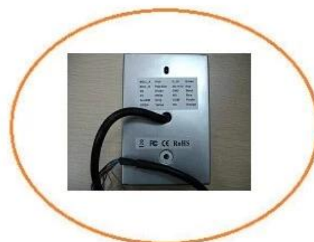
Back of the reader