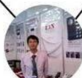
2012 Shenyang Fair