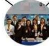
2015 Shenzhen Fair