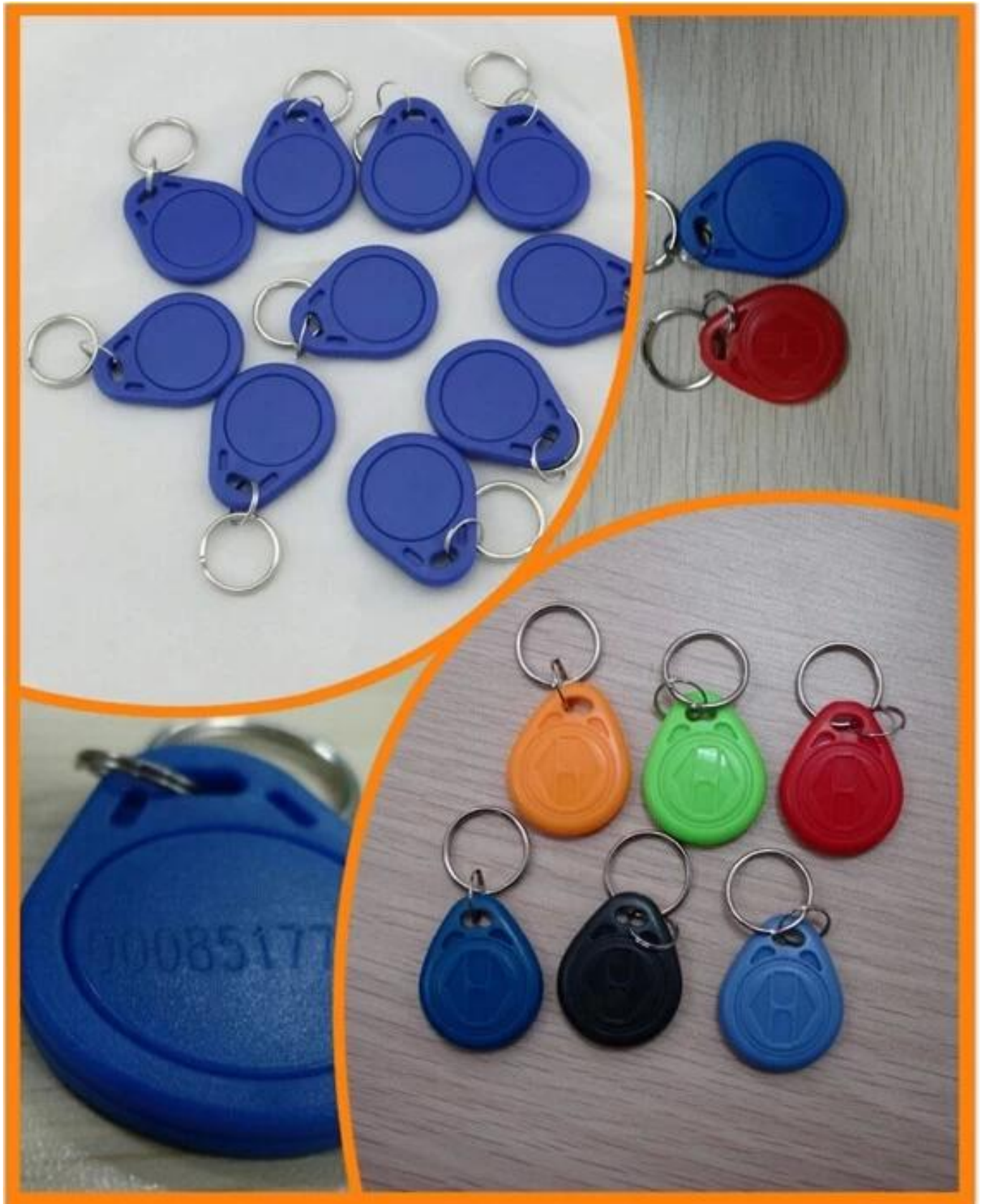
● Dimesion Picture