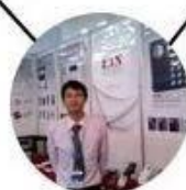
2012 Shenyang Fair