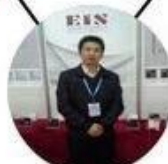
2013 Shenyang Fair