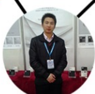
2013 shen yang Fair