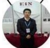
2013 Shenyang Fair