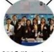
2015 Shenzhen Fair