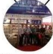
2013 Shenzhen Fair