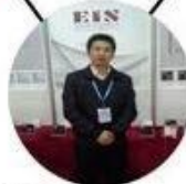
2013 Shenyang Fair