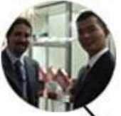
2011 Brazil Fair