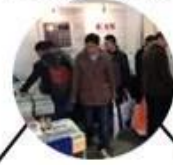
2013 Jinan Fair