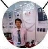
2012 Shenyang Fair