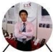
2012 Shenyang Fair