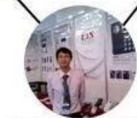
2012 Shenyang Fair