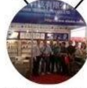
2013 Shenzhen Fair