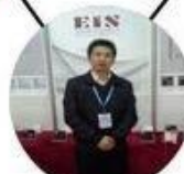
2013 Shenyang Fair