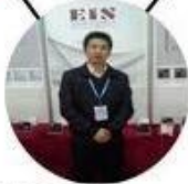
2013 Shenyang Fair