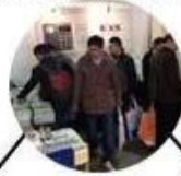
2013 Jinan Fair