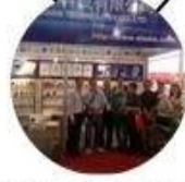
2013 Shenzhen Fair