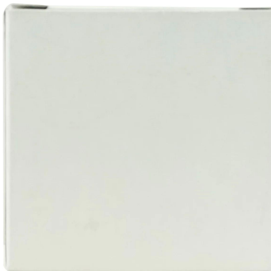
Natural paper box