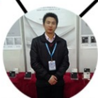
2013 shen yang Fair