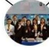
2015 Shenzhen Fair