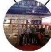
2013 Shenzhen Fair