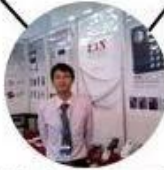
2012 Shenyang Fair