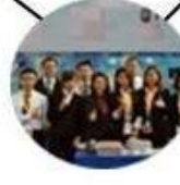
2015 Shenzhen Fair