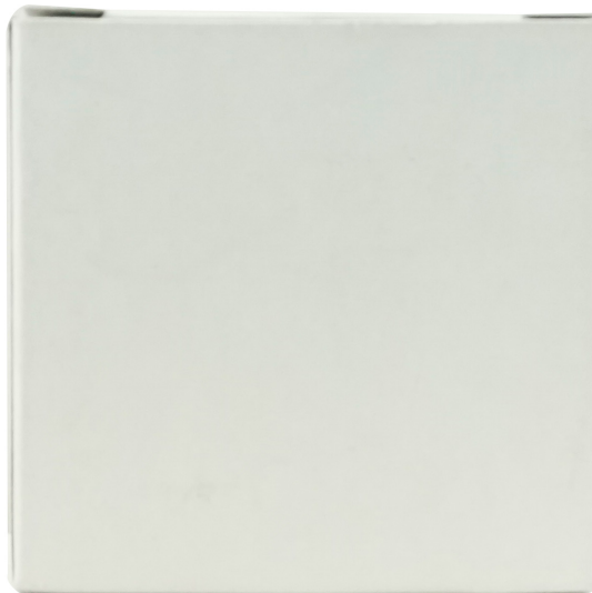
Neutral paper box