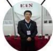
2013 Shenyang Fair