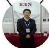
2013 Shenyang Fair