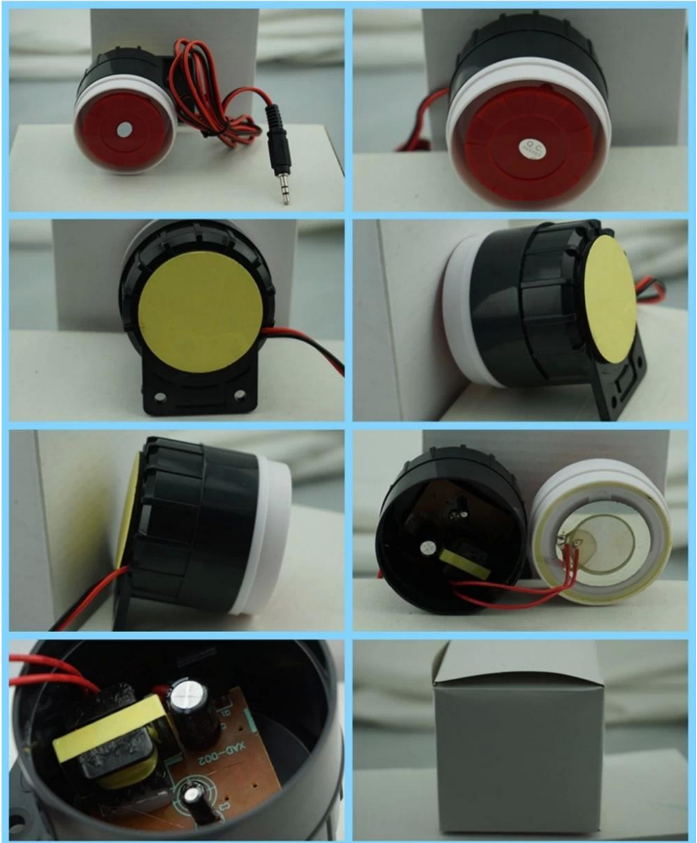
Las alarmas de emergencia pequeños Sirenas eléctricas de EB-163