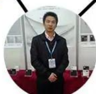
2013 shen yang Fair