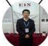
2013 Shenyang Fair