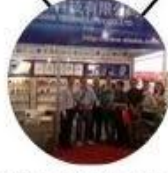
2013 Shenzhen Fair