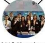
2015 Shenzhen Fair