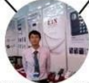
2012 Shenyang Fair