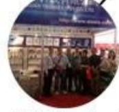
2013 Shenzhen Fair