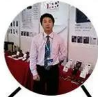
2012 shen yang Fair