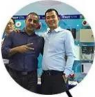
2011 Brazil Fair