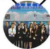
2015 Shenzhen Fair