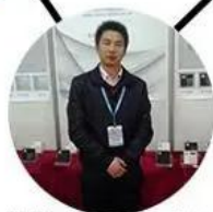
2013 shen yang Fair