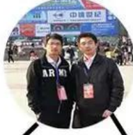
2013 Jinan Fair