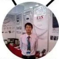
2012 shen yang Fair