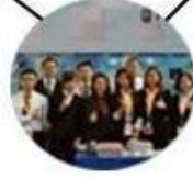
2015 Shenzhen Fair