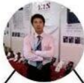
2012 Shenyang Fair