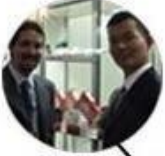
2011 Brazil Fair