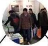
2013 Jinan Fair