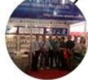
2013 Shenzhen Fair