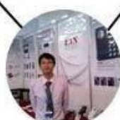
2012 Shenyang Fair