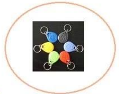
Key tag colors