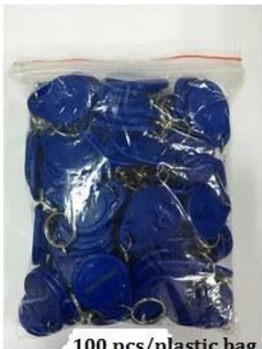
100 pcs/plastic bag