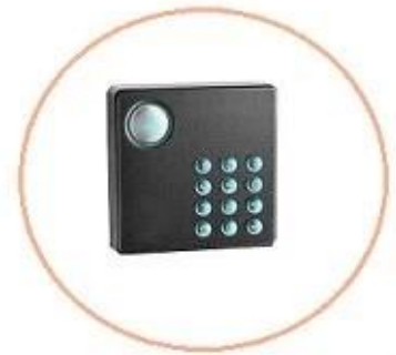
WG card reader