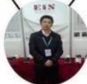
2013 Shenyang Fair