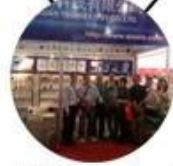
2013 Shenzhen Fair