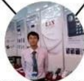
2012 Shenyang Fair