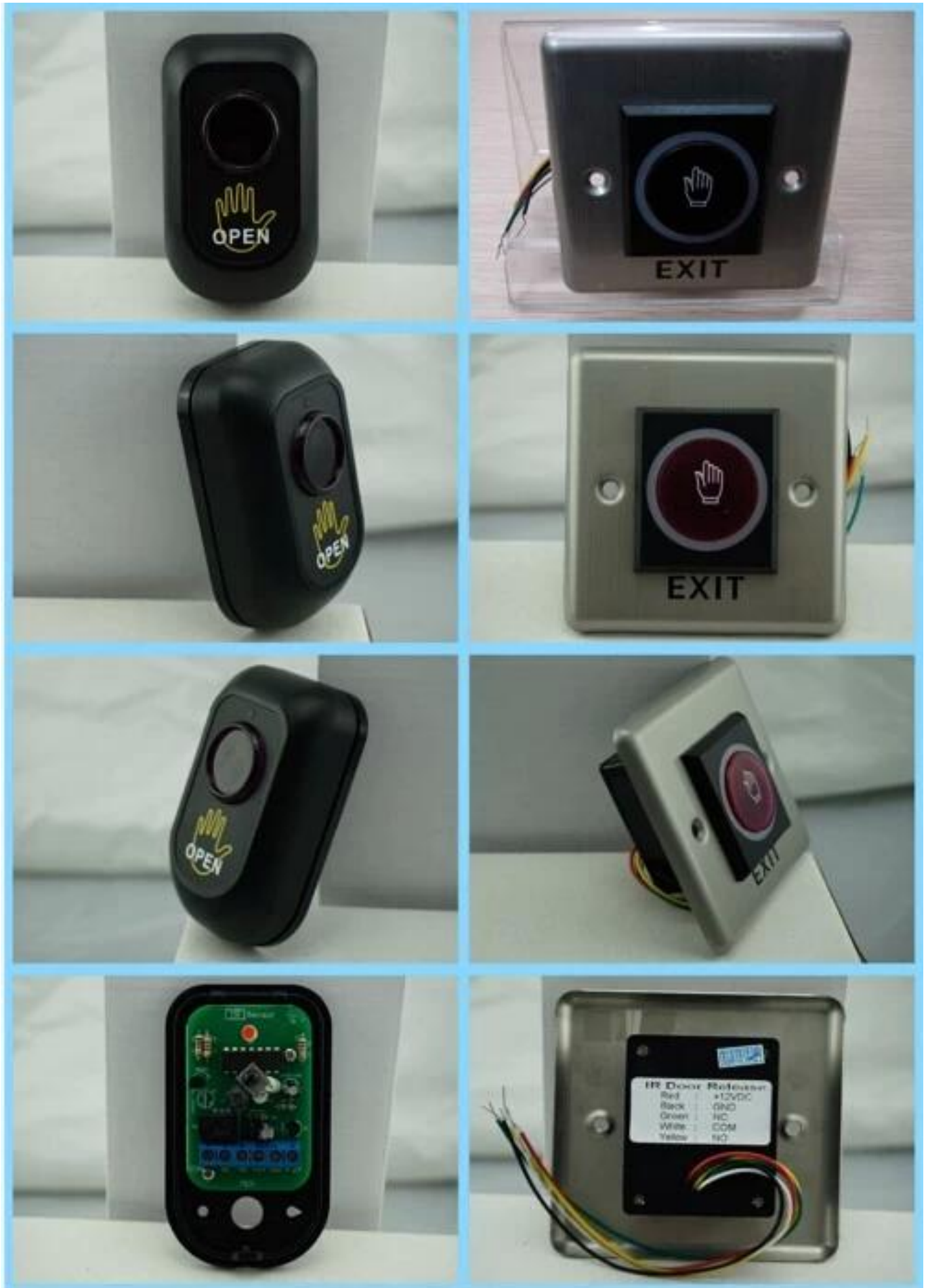
Botão de saída de controle de acesso incluído botão de