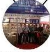
2013 Shenzhen Fair