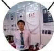
2012 Shenyang Fair