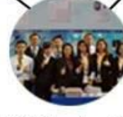
2015 Shenzhen Fair