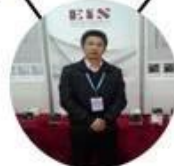
2013 Shenyang Fair