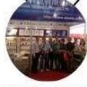
2013 Shenzhen Fair