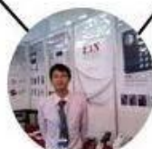
2012 Shenyang Fair