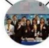
2015 Shenzhen Fair