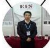
2013 Shenyang Fair