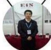
2013 Shenyang Fair